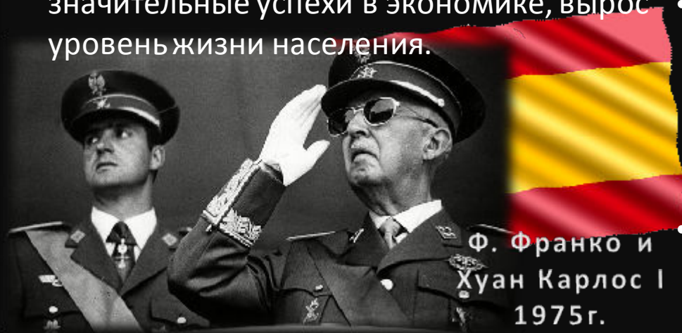
Ф. Франко и Хуан Карлос I 1975г.