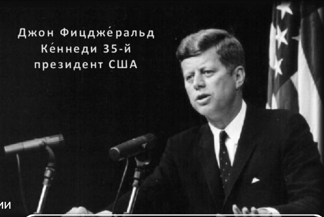
Джон Фицджеральд Кеннеди 35-й президент США

• ликвидация неравноправия, бедности, преступности, • предотвращение ядерной войны.