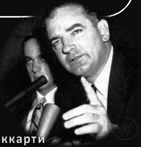
Сенатор Дж. Маккарти