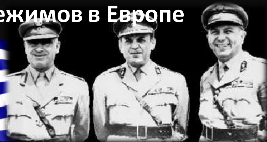
«Черные полковники» - Георгиос Пападопулос, Николаос Макарезос и Стильянос Паттакос