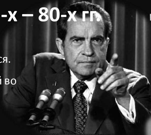
Ричард Милхауз Никсон 37-й президент США