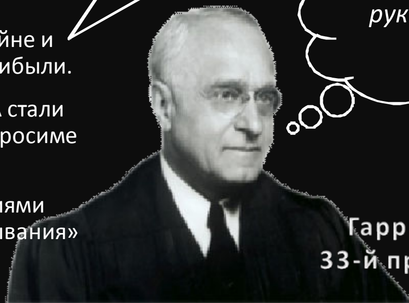
Гарри Эс Трумэн 33-й президент США