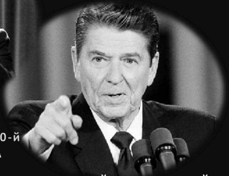
Рональд Рейган 40-й президент США