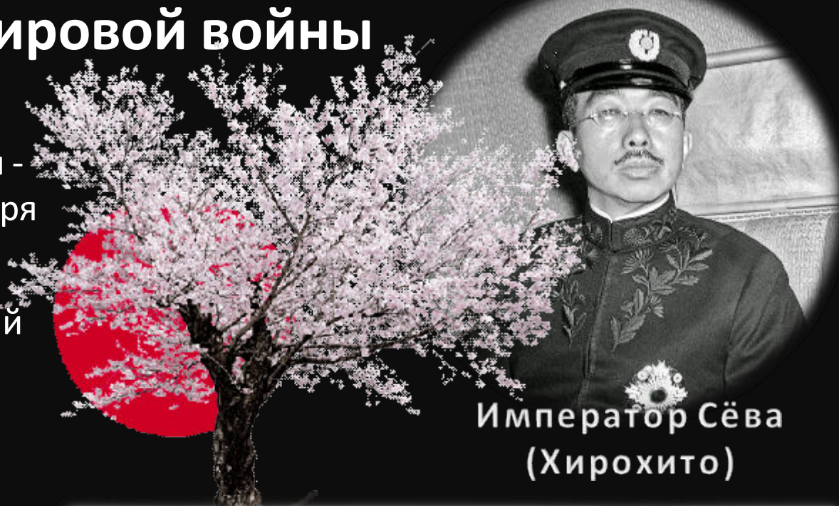
Император Сёва (Хирохито)